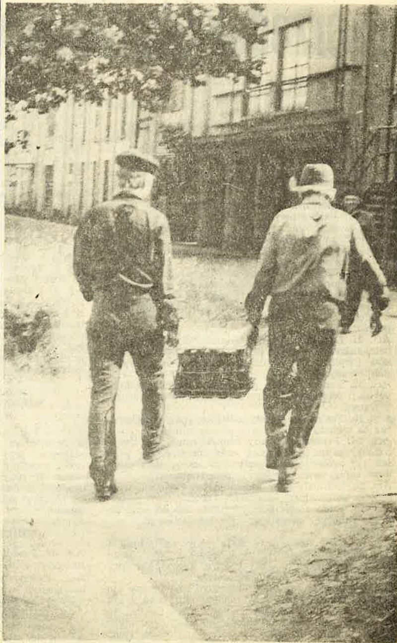
Koniec lata. Pora odnieść butelki...

Wydaje się to dobrym wytłumaczeniem. Kobiety zawsze umiały tłumić w sobie agresywność, podczas gdy mężczyźni wyrażają ją otwarcie. Kobiety są dwukrotnie bardziej niż mężczyźni skłonne do zazywania środków uspokajających i zapadania na choroby psychosomatyczne. Prawidłowy wizerunek nie dopuszcza takich uczuć, jak wściekłość czy zarożumiałość. To co jest często określane jako masochizm kobiet, jest w istocie inaczej ukierunkowaną agresywnością i być może do tego zalicza się również nałóg palenia... Kobiety często mówią, że palenie je uspokaja, gdy się źle czują.