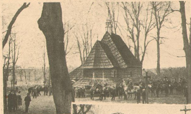
Ritt um die Kirche in Lerchenfeld bei Groß-Peterwitz. L. ist ein bekannter ober-schlesischer Wallfahrtsort