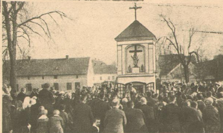
Schlussandacht an der Wegekreuzung. Nachher werden die Reiter von der Gesellschaft in die Kirche geführt