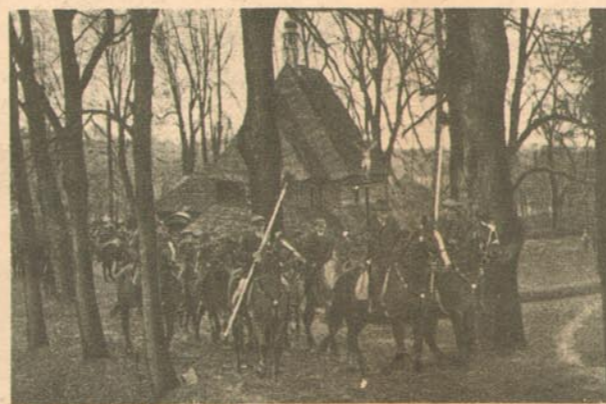
Aufbruch nach der Andacht