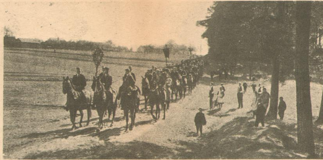
Ostereiter in der Gemarkung des Dorfes