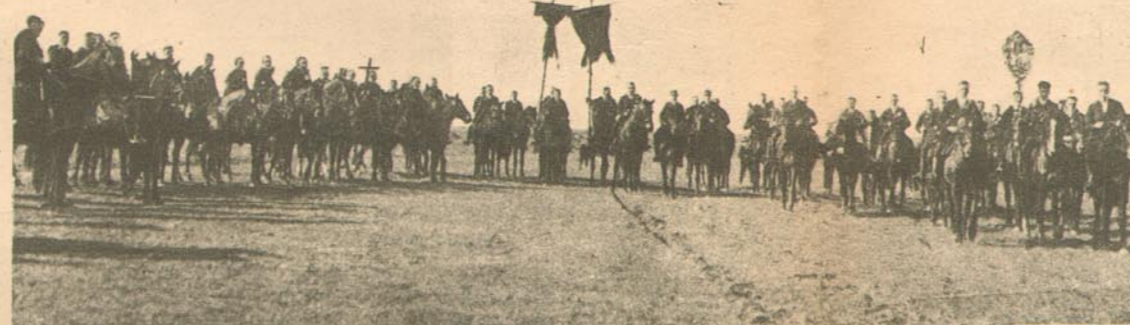
Vor der Kaff wird ein Kreis geritten, der die Bitte deutet, die Ernte möge vor Hagel geschützt sein