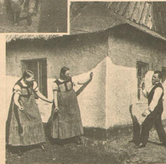
Osterspröhen (genannt Ojngos) bei den Schönwäldlerinnen