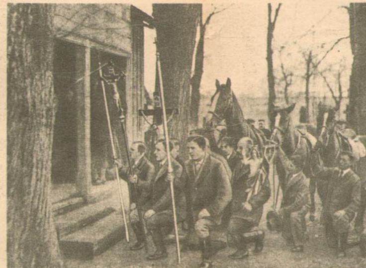
Vor Hineingehen in die Kirche ein kurzes Gebet