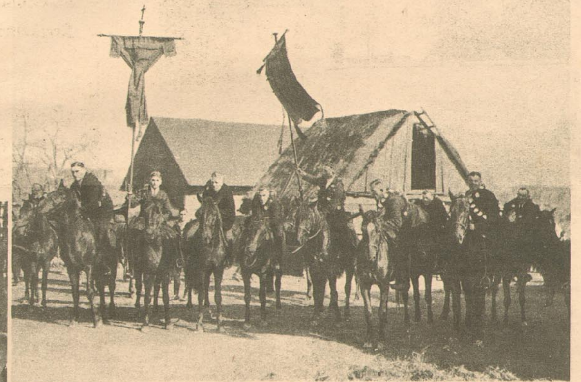
Abstehen im Gehöft, wo die Reiter mit Kaffee und Kuchen bewirtet werden.