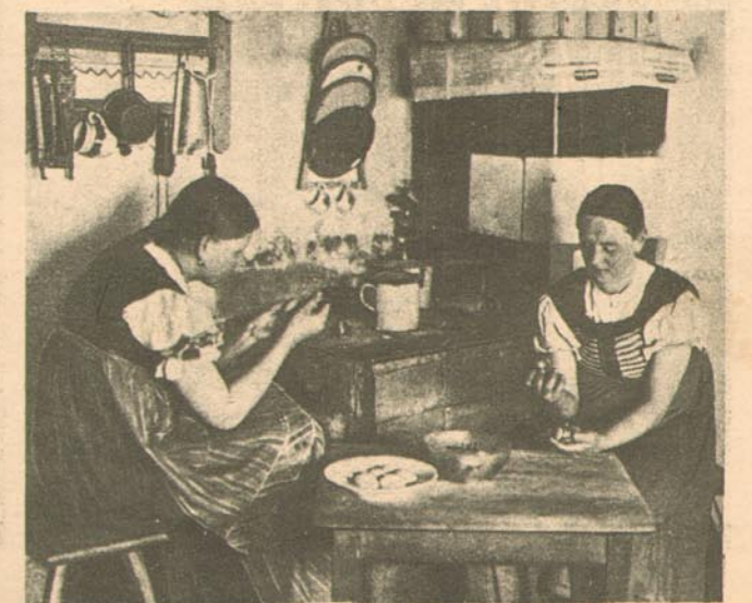
Schönwäldlerinnen beim Ostereiermalen