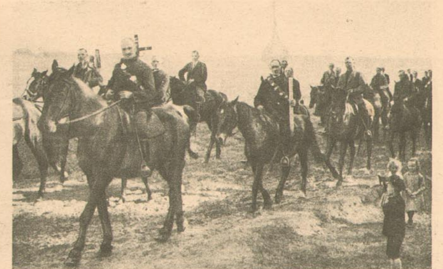
In der Mitte der Ostereiter der Gemeindevorsteher mit dem hl. Kreuze, rechts der Reiter mit der Auferstehungskirche, links der Reiter mit der Figur des auferstandenen Heilands